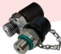
ミニメス ガス充填バルブ