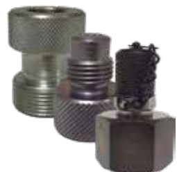
アキュムレータアダプタ