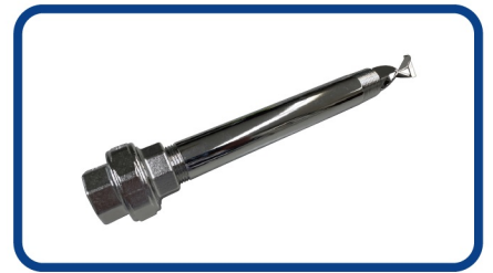
ねじ込みユニオン

食品・飲料業界、医薬品、半導体業界では、CIP（Clean In Place）定置洗浄が求められており、電解研磨されたSUS316L製スタティックミキサーがおすすめで、 簡単に洗浄できるようエLEMENTも取り外し可能です。