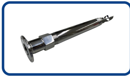
ヘルール ねじソケット