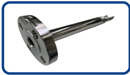
JIS 10K RF ねじフランジ

テフロンモデルは、全ての部材がPTFE製で、クリーン且つ耐食性・耐薬品性が求められる用途で使用できます。サニタリー仕様への追加バフ研磨へも対応！ ■バフ研磨+電解研磨標準仕様■