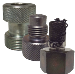
アキュムレータ接続用アダプタ