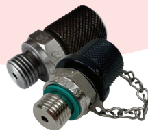
ミニメス ガス充填バルブ